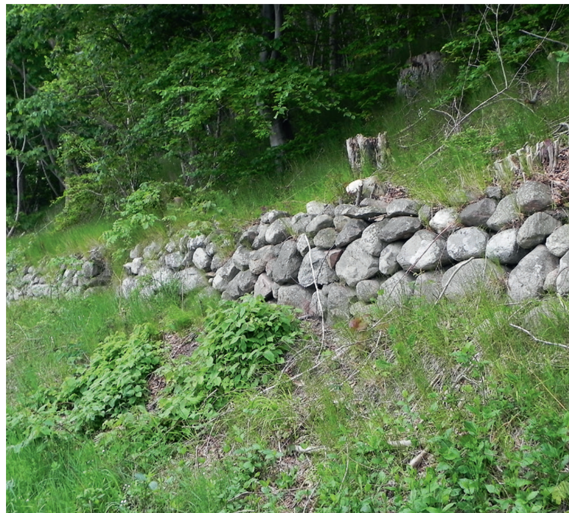
Annebjerg Skov.

DN Odsherred skal opfordre kommunen til at opprioritere indsatsen på fortidsmindeområdet med bl.a. brug af QR-koder, der på stedet kan uddybe kendskabet til det enkelte fortidsminde. Desuden må det være en selvfølge, at de hævdevundne stier til fortidsminderne holdes farbare.