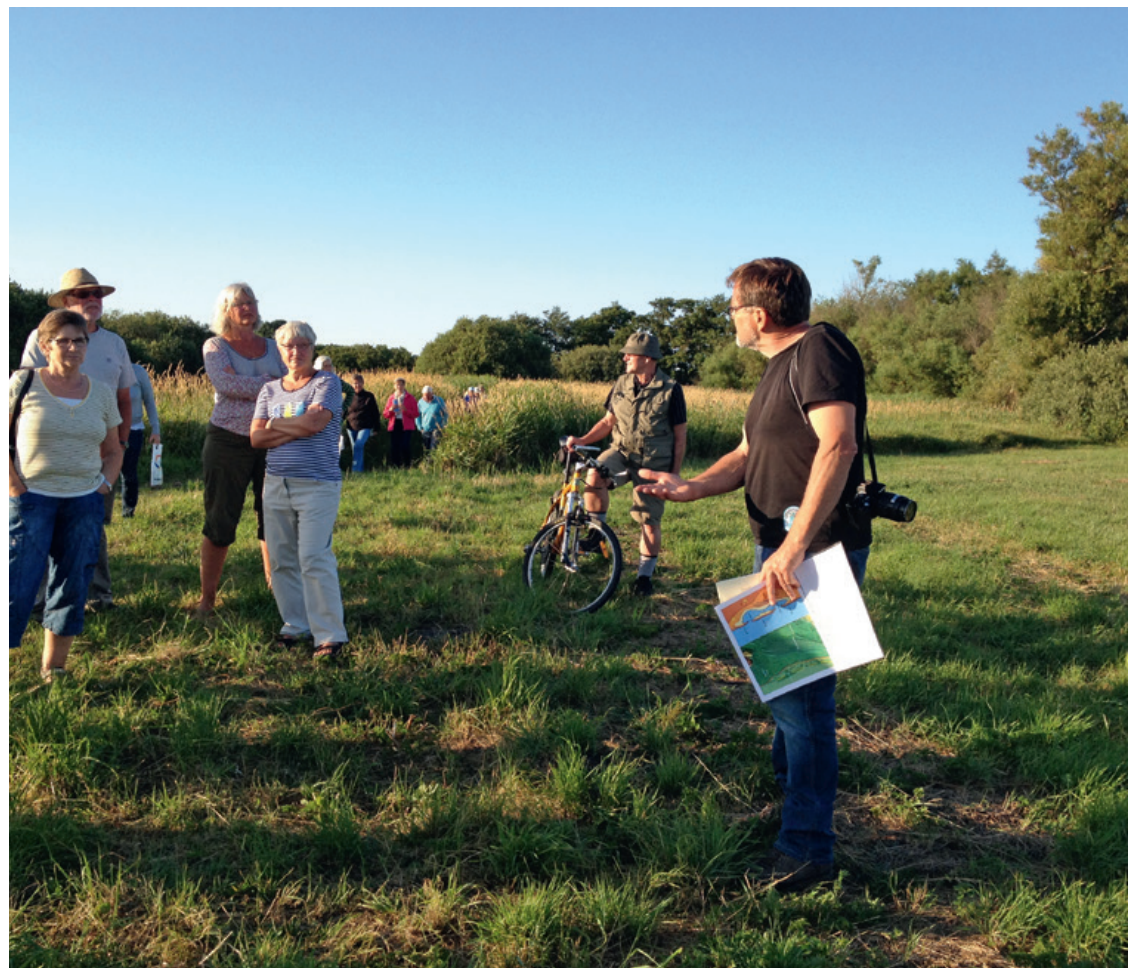
Trundholm Mose.

mindst de økologiske til gavn for klimaet, miljøet og dermed os alle. Odsherred Kommune er klimakommune og kunne dermed arbejde mere aktivt for at øge den økologiske produktion af fødevarer og dermed tilføre området endnu en kvalitet.