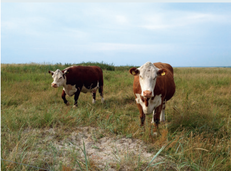
Vig Lyng.

Odsherred er præget af, at der ikke, som i Midt- og Sydsjælland, er store godser, der dominerer landskabet med store, ensformige marker. Tværtimod er landskabet, bortset fra nogle af de inddæmmede arealer, fortsat præget af, at jorden har været dyrket af mange mindre landbrug, også selv om jorden nu er samlet under færre ejere. Det betyder, at landskabet er en mosaik af