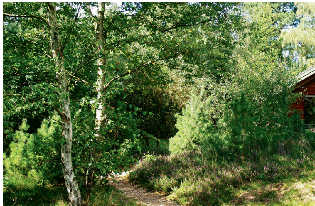
Sommerhus med naturgrund.

Det kan blive nødvendigt at sikre visse lokaliteter med udsigtsfredninger og forbud mod skovrejsning i området mellem kysten og de bagved liggende turistveje. Samtidig kan kommunen anbefale sommerhusejerne i disse områder at fælde de højeste nåletræer, som også af nabohensyn er en uskik. ■