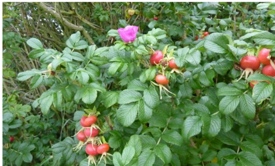
Rynket rose - Rosa rugosa - er stadig blandt de arter, som anses for stærkt invasive.

Oversigten over invasive arter i Danmark bliver fremover på 77 arter mod tidligere 136. Baggrunden er nye vurderinger fra en gruppe eksperter, som har skærpet kriterierne for, hvad der definere en invasiv art.